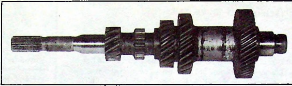
Arbre primaire : ZA. 4 264 740