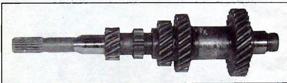
Arbre primaire : ZA. 4 252 883